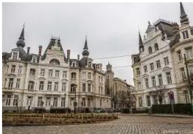
Een straat met eclectische architectuur.

Voor deze wandeling dient ge in te schrijven met vermelding van de datum waarop ge mee wandelt en hoe ge u naar Berchem station verplaatst (fiets, bus of auto). Indien ge ingeschreven bent en om een onverwachte reden niet kunt komen verwittig ons dan aub.