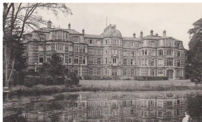
Het Ravenhof Stabroek – www.delcampe.be

Deze wandeling brengt ons langs het Ravenhof, Moretusberg, De Stoppelbergen, ... naar Zandvliet. Daar