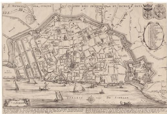
Vesting Antwerpen in 1678 , Le Roy Felixarchief

Tijdens de 16 de eeuw volgde dan een tweede hoogtepunt met de bouw van de “Spaanse Wallen” die onder impuls van projectontwikkelaar “avant la lettre” Van Schoonbeke plaats boden aan een eerste havenuitbreiding.