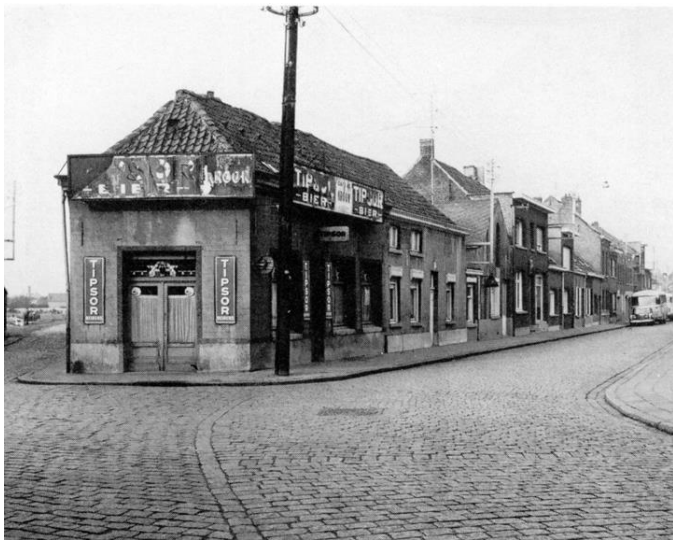
“De Kroon” – Bij “Mesjeuke” Hoeveel dochters had deze herbergier?

Op 1 mei neemt onze kring deel aan de actie “Kom op tegen kanker” in het Brieleke. Je kunt er kennis maken met verschillende verenigingen en mits een bijdrage aan “Kom op tegen kanker” ook deelnemen aan een waaier van activiteiten. Onze kring stelt een vijftal panelen op waarop je herbergen, waar Wommelgem in het verleden zo rijk aan was, kunt herkennen. Over elke herberg wordt een vraag gesteld die je moet oplossen. Mogelijk kun je de oplossing uit de mouw schudden maar als de oplossing in de mouw blijft steken is er nog de stand van de heemkundige kring waar je in “documenten” de oplossing kunt zoeken. Werken als een heemkundige dus!