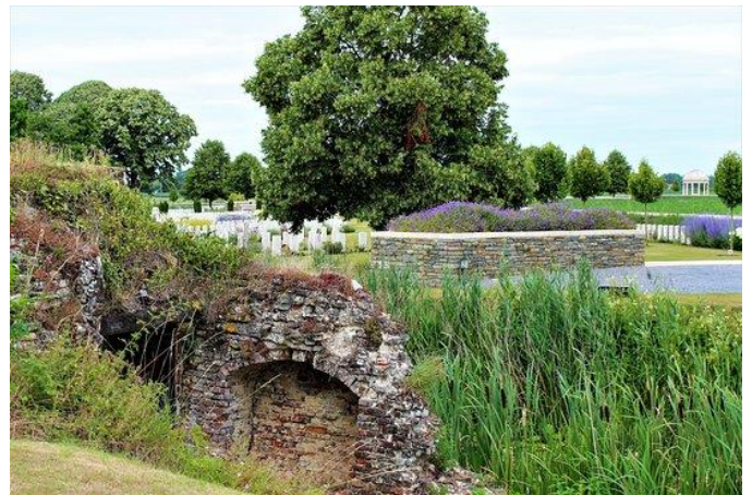
Bedford house Cemetery

In samenwerking met het Davidsfonds We pikken onze gids, Philippe Despriet, op in Kortrijk en vandaar rijden we naar Zillebeke waar we de thematuinen in het kasteelpark bezoeken. De tuinen zijn gewijd aan de verschillende naties die hier tijdens WO1 gevochten hebben. Na een korte pauze – koffie met koek – maken we een ritje naar Hill 62, de beruchte positie van de Canadezen, met een prachtig panorama op het fel bevochten Ieper en een indrukwekkende begraafplaats. Dan gaat het naar Bedford House Cemetery, Unesco wereld-erfgoed met de resten van het omwalde kasteel.