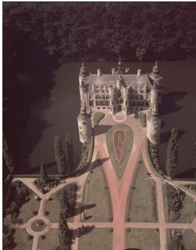
Kasteel van Vorselaar

In de namiddag wandelen we langs het kasteel van Vorselaar en de Vispluk richting Sassenhout waar we bus 420 naar Wommelgem nemen. Terug rond 17.00 uur.