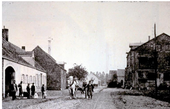
"Brouwerij van Wommelgem" (links) en landbouwstokerij "Juniperus" (rechts)

langs de nog bestaande bezienswaardigheden of plaatsen die een rol speelden in de (kleine) Wommelgemse geschiedenis. De wandeling wordt ingewandeld op 21 april. Meer informatie in onze volgende mededelingen