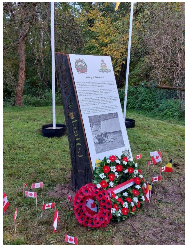
Het nieuwe monument in de Terhagelaan – foto N. Van Kerckhoven

Onze gemeente wou dit stukje geschiedenis onder de aandacht van de bevolking brengen en daarom werd in de