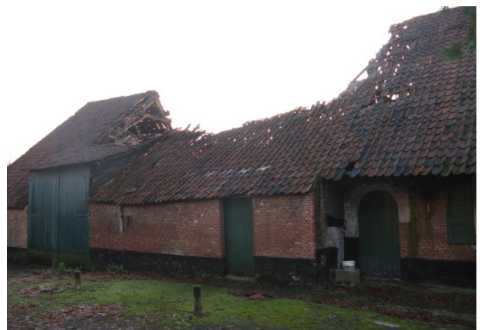
De Selsaetenhoeve "Hoeve Van der Beuren"

Onze kring heeft de betreffende erfgoed instanties op de hoogte gebracht van deze toestand maar..... blijkbaar hebben ze daar niet begrepen waarover het gaat. 't Is nochtans duidelijk aangegeven ...en reeds vroeger werd de erbarmelijke toestand waarin de hoeve verkeert (op 7 november 2019 m.n.), gesignaleerd (toen was het dak nog niet ingevallen).