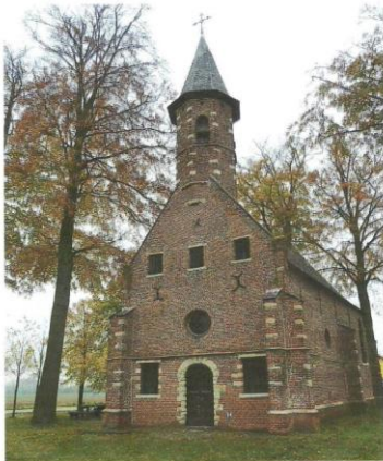
Wommelgemse Heemkundige Kring De Kaeck Jacques baron Le Roy Genootschap

Leden die zich deze uitgave willen aanschaffen kunnen dit door overschrijving van 10,-Euro op de bankrekening van "De Kaeck" met vermelding "uitgave Obiits" en het leveringsadres.